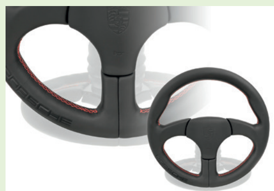
Teile-Nr. 000043161158YR EUR 654,-*

Beinahe selbst schon ein Klassiker: das 3-Speichen-Sportlenkrad in schwarzem Leder mit geprägtem Wappen und roter Ziernaht. Verwendbar für 911 (1974–1989) und 959 (1987–1988).**