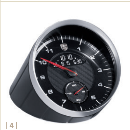
| 4 |