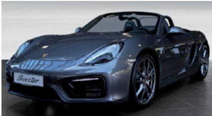
Porsche Zentrum Gießen www.porsche-giessen.de