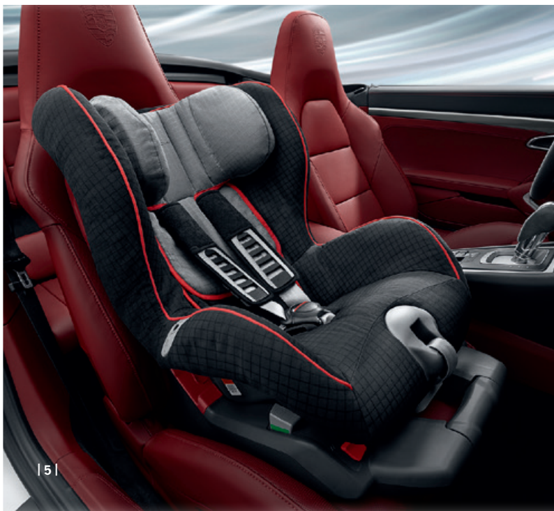
| 5 |