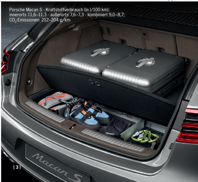
| 3 |

Porsche Macan S - Kraftstoffverbrauch (in l/100 km): innerorts 11,6–11,3 · außerorts 7,6–7,3 · kombiniert 9,0–8,7; CO 2 -Emissionen: 212–204 g/km