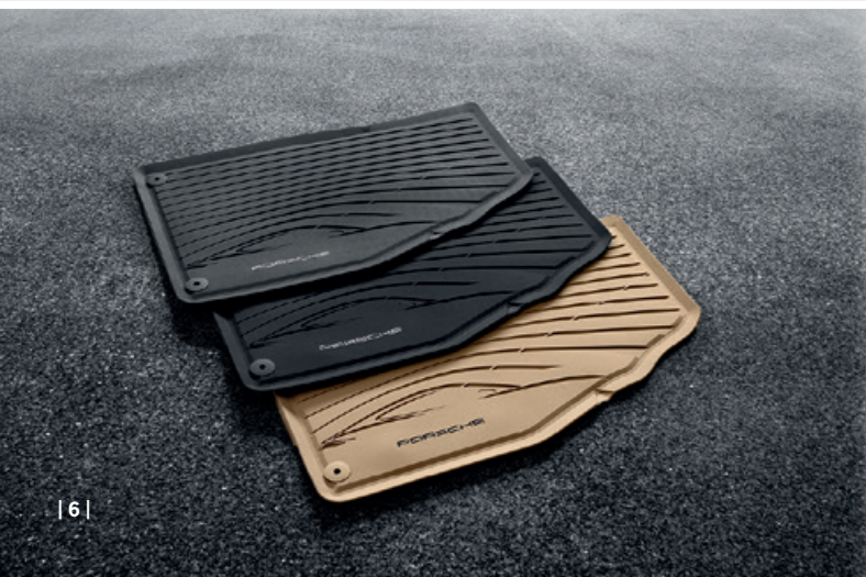
| 6 |