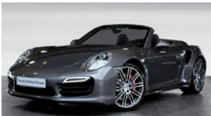
Porsche Zentrum Gießen www.porsche-giessen.de

Porsche 911 Carrera 4S , 294 kW (400 PS), EZ 06/14, 27.780 km, anthrazitbraun-metallic, Lederausstattung inkl. Sitze schwarz, ParkAssistent vorne und hinten, Komfortpaket, Porsche Active Suspension Management (PASM), Reifendruckkontrollsystem (RDK), vollelektrische Sportsitze (14-Wege) mit Memory-Paket, 20-Zoll Carrera S Rad u. v. m., MwSt. ausweisbar, EUR 92.780,-