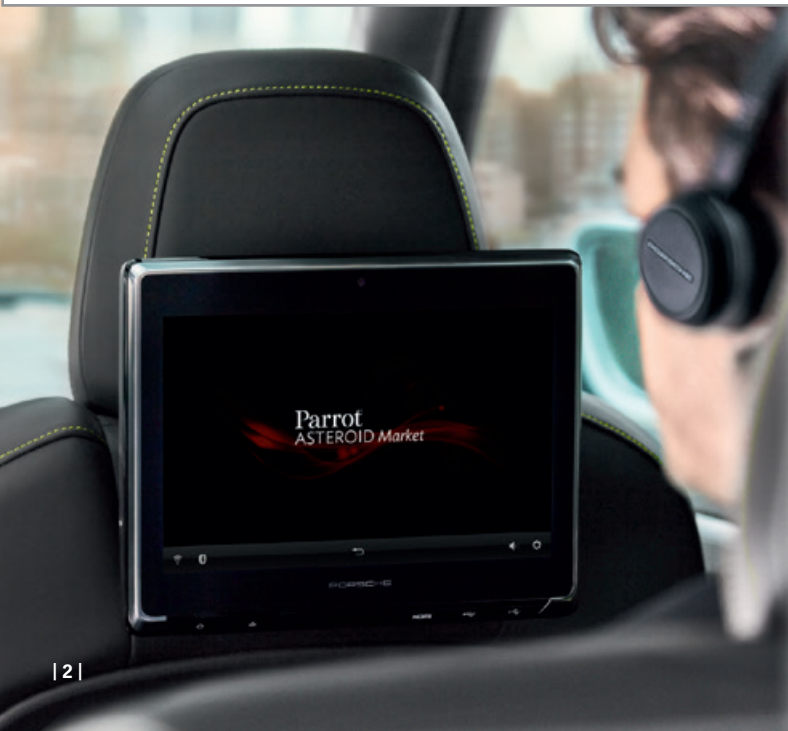
| 2 |