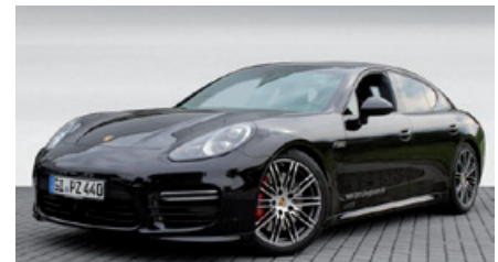
Porsche Zentrum Gießen www.porsche-giessen.de

Porsche Panamera 4S , 309 kW (420 PS), EZ 08/13, 17.950 km, mahagoni-metallic, Interieur-Paket Nussbaum-Wurzel. Hinweis: Nur noch verfügbar bis einschließlich KW 44/2013, Bi-Xenon-Hauptscheinwerfer inkl. Porsche Dynamic Light System (PDLS), Porsche Communication Management (PCM) inkl. Navigationsmodul, BOSE® Surround Sound-System, 20-Zoll RS Spyder Design Rad u. v. m., EUR 79.870,-