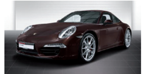
Porsche Zentrum Gießen www.porsche-giessen.de

Porsche 911 Carrera 4S , 294 kW (400 PS), EZ 11/12, 68.200 km, racinggelb, Lederausstattung inkl. Sitze schwarz, Porsche Communication Management (PCM) inkl. Navigationsmodul und universeller Audio-Schnittstelle, ParkAssistent vorne und hinten, BOSE® Surround Sound-System, Telefonmodul, Porsche Dynamic Light System (PDLS), Online-Dienste, Sportabgasanlage, Tempostat, 20-Zoll Carrera S Rad u. v. m., MwSt. ausweisbar, EUR 79.870,-