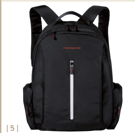
| 5 |