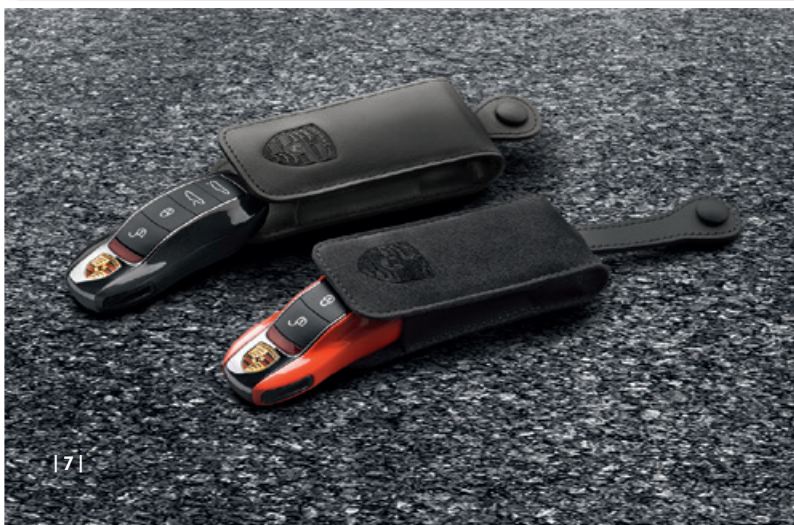
| 7 |