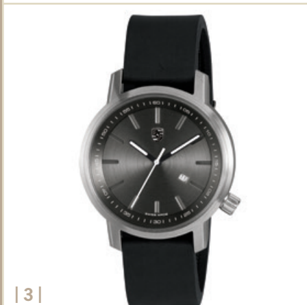
| 3 |