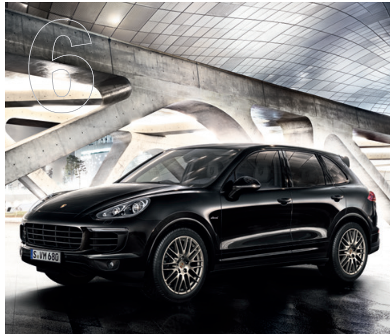
Atemberaubende Sportlichkeit in Vollendung. Die Cayenne Platinum Edition Modelle.