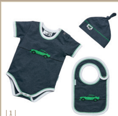
| 1 |