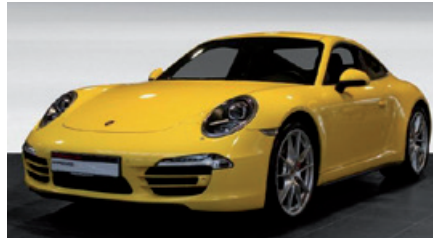
Porsche Zentrum Gießen www.porsche-giessen.de

Porsche Boxster GTS mit PDK , 243 kW (330 PS), EZ 04/16, 12.500 km, achatgrau-metallic, Interieur-Paket GTS rhodiumsilber, Porsche Communication Management (PCM) inkl. Navigationsmodul und universeller Audio-Schnittstelle, ParkAssistent vorne und hinten, 20-Zoll Carrera S Rad lackiert in Platinum (seidenglanz) u. v. m., MwSt. ausweisbar, EUR 95.900,-