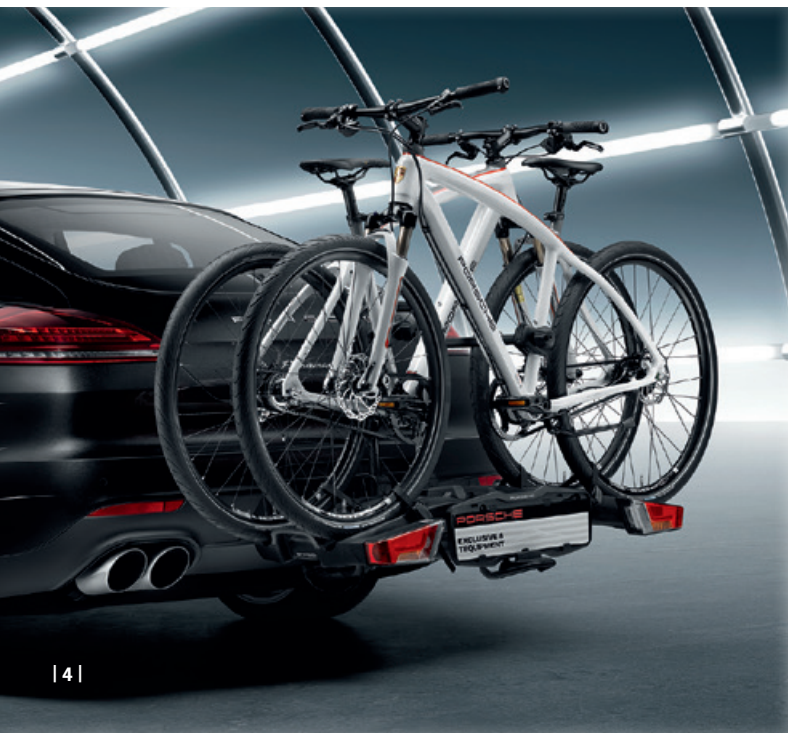
| 4 |

Porsche Macan S - Kraftstoffverbrauch (in l/100 km): innerorts 11,6–11,3 · außerorts 7,6–7,3 · kombiniert 9,0–8,7; CO 2 -Emissionen: 212–204 g/km