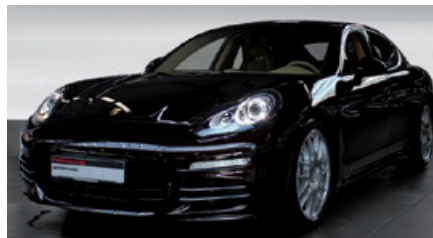
Porsche Zentrum Gießen www.porsche-giessen.de

Porsche 911 Turbo Cabriolet mit PDK , 383 kW (520 PS), EZ 05/15, 10.150 km, achatgrau-metallic, Lederausstattung inkl. Sitze in Naturleder espresso, ParkAssistent vorne und hinten inkl. Rückfahrkamera, LED-Hauptscheinwerfer inkl. Porsche Dynamic Light System Plus (PDLs+), Telefonmodul, 20-Zoll 911 Turbo Rad u. v. m., MwSt. ausweisbar, EUR 164.790,-