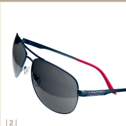
| 2 |