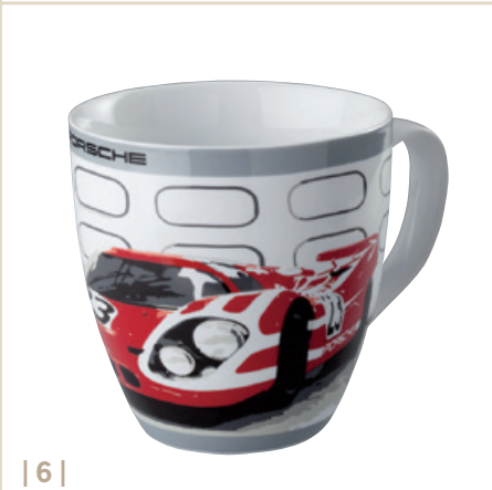
| 6 |